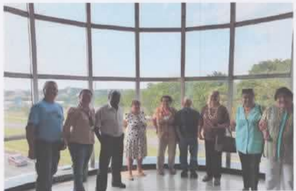
Shopping Serra Azul